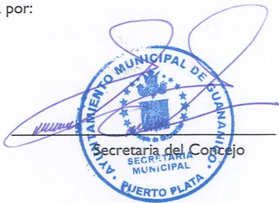
Secretaria del Concejo