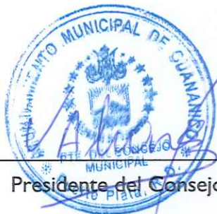
Presidente del Consejo de Regidores